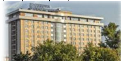
Гостиница «Интурист Коломенское»

Конференция будет проводиться в гостинице «Интурист Коломенское»: Каширское шоссе, 39Б (станция метро «Каширская»).